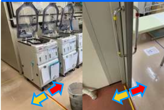
感染防止のための区分け