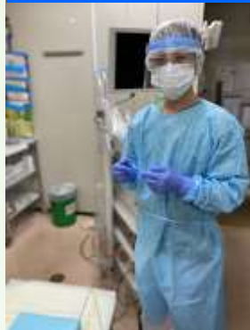
シールド・ガウン