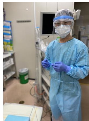
シールド・ガウン