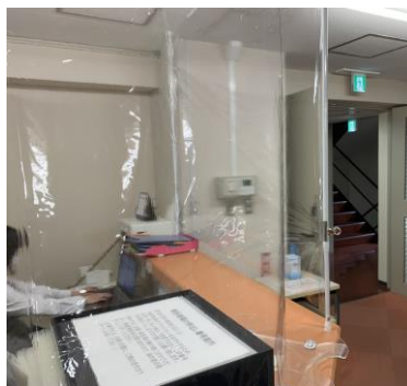
健診受付カウンター